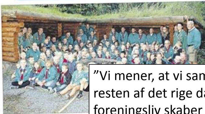
Stor og små spejdere klar til et nyt spejderår. Til man værer Set. Michael-gruppe - kammer og ind på gruppen hjemme